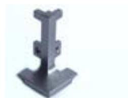
Terminal Esquinero Externo para tiradores cajonera CN-JN