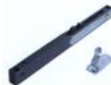
Freno a pistión cierre suave