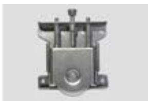
Rueda chapa 48mm