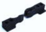
Frenos de PVC

Felpa gris de 5mm de base x 5mm de alto de pelo. Suministro: por mts lineal y/o por rollo de 300mts.