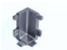
Terminal Esquinero Interno para tiradores cajonera CN-JN