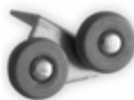
Estabilizador con ruleman